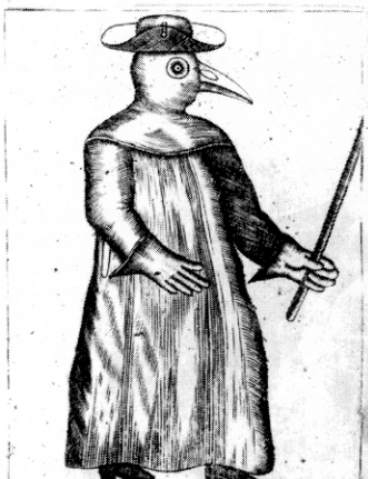
Habit des Medecins, et autres personnes qui visitent les Pestiferes. Il est de marroquin de loutant, le masque a les yeux de cristal, et un long nez rempli de parfums